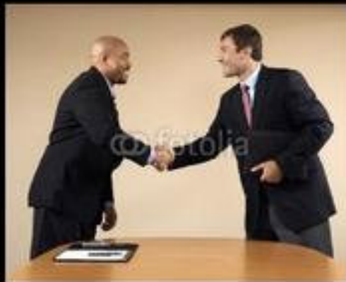
What my mom thinks I do