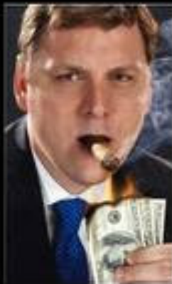
What society thinks I do