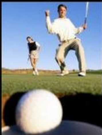
What clients think I do