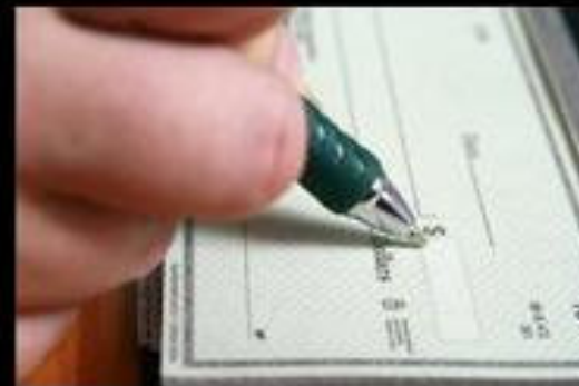
What politicians think I do