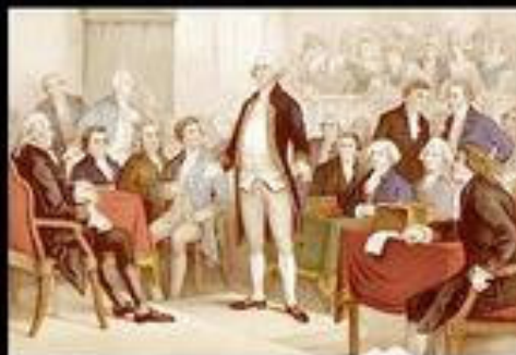
What I think I do